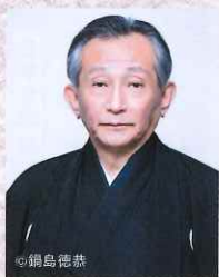
二十六世観世宗家 観世 清和